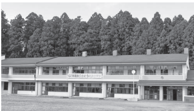
▲県の埋蔵文化財センターとして利用されることになった旧北方小学校の校舎

④次世代を担う豊かな心の育成と歴史・伝統を大切にすまちづくり 幼児教育・学校教育の充実 ●老朽化に伴う桂中学校屋内運動場の改築や遊具の補修、常北・桂小学校の屋内運動場の耐震補強等を行い、より安全な教育環境の整備を図ります。 ●保育園・幼稚園における国の改定基準保育料よりも保育料を引き下げ、その差額を町が補填することにより保護者の負担を軽減します。 芸術・文化の振興 ●廃校となった旧北方小学校の跡地に県の埋蔵文化財センターを誘致し、廃校の有効活用と雇用の創出を図ります。