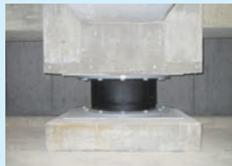
積層ゴムアイソレーター

建物を支える基礎部分に設置した免震装置が、地震エネルギーを吸収し、被害を最小限に抑えます。