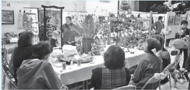
桂公民館(11月8日・9日)