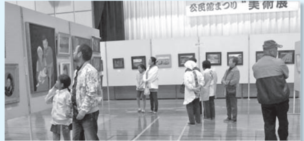
常北公民館(11月15日・16日)