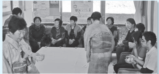
七会公民館(11月1日・2日)

今年もたくさんの方々のご協力により、華やかでとても素敵な作品が展示され、訪れた方々の目を楽しませました。