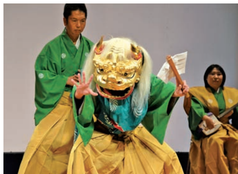
▲水戸大神楽「獅子舞」

また、式典後のアトラクションでは約400名の招待者が、茨城県並びに水戸市無形民俗文化財の水戸大神楽の「獅子舞」や「紙きり」などの伝統芸能を堪能したり、桂太鼓の迫力ある演奏に耳を傾けたりして楽しいひと時を過ごしました。