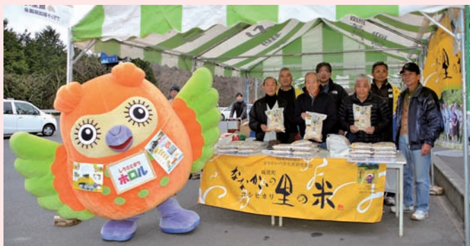
▲城里町新米キャンペーン会場にて

町ではこれを記念し、「城里町新米キャンペーン」を12月19日～21日の3日間物産センター山桜で開催し、ななかいの里コシヒカリの直売やふるさと納税にご協力いただいた方に町内産コシヒカリをプレゼントする企画などを実施しました。