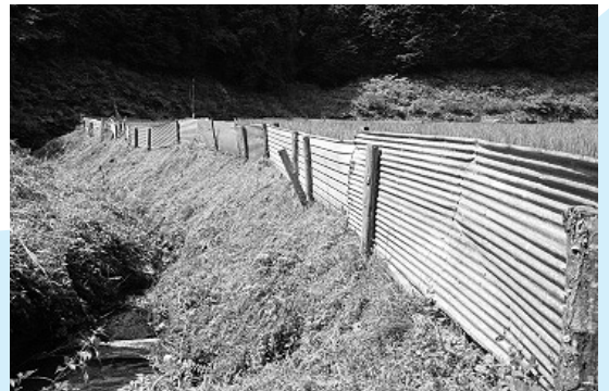
▲防護柵はイノシシが侵入しないように、すき間なく設置しましょう。また、イノシシが隠れやすいヤブを作らないよう心がけましょう。

耕作放棄地や周辺のヤブはイノシシにとって良い隠れ場所になってしまいます。草刈りなどをこまめに行い、イノシシの隠れ場所をなくしましょう。