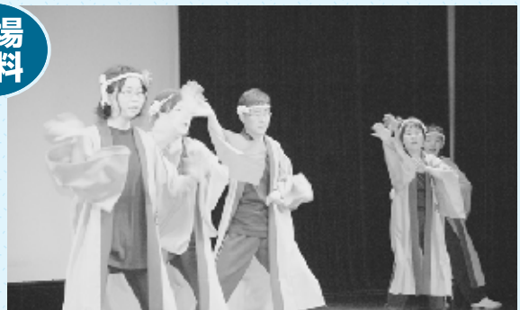
▲前回の合同ステージ発表会の様子「桂公民館 YOSAKOI」