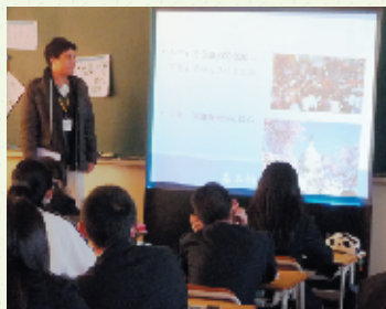
アメリカの留学生から、歴史・文化などの話を聞く1年生