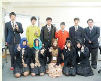
インドネシアの民族衣装を身につけて、留学生と記念写真を撮る3年生

今回は12日に1年生、13日に3年生が、各国の留学生と交流を深めました。マレーシア、台湾、ハンガリー、タイ、アメリカ、オーストラリア、インドネシア、中国と8カ国計10名の留学生が来校し、国際色豊かな2日間になりました。