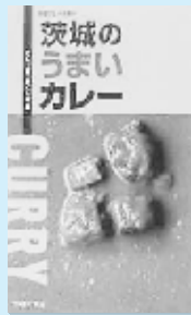
カレー食べつくし隊 茨城新聞社

こよなくカレーを愛し、カレー中心の食生活を送る7人が厳選した、茨城のカレー店50を紹介。茨城のご当地レトルトカレー、カレーのまち土浦、古河の七福カレーめんも収録。