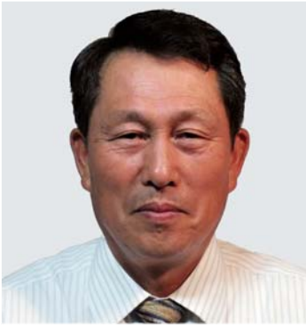
その べ 菌部 はじめ 一 議員