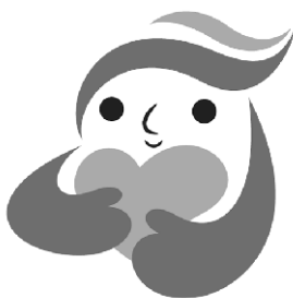
犯罪被害者等支援シンボルマーク

犯罪被害者への理解と配慮が、誰もが安心して暮らせる社会へつながります。地域一帯となつて、犯罪防止や犯罪被害者のために何ができるかを考えていきましょう。