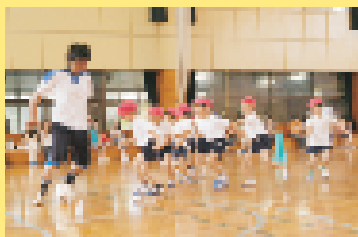
◀「俊ちゃん」と試合みんなシュートを決めようと必死です！