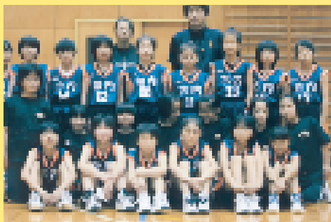
古内ミニバススポーツ少年団