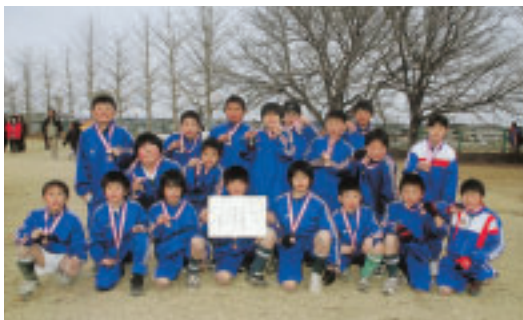
見事3位入賞を果たした常北SSS

大会には近隣市町村から12チームが参加。町内からは、桂サッカースポーツ少年団と常北サッカースポーツ少年団が参加しました。各チームとも日ごろの練習の成果を発揮し熱戦を繰り広げるなか、低学年の部では常北サッカースポーツ少年団が第3位に入賞しました。結果は次の通りです。