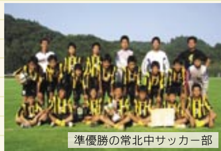
準優勝の常北中サッカー部

大会には近隣の12中学校が参加。高レベルの試合が繰り広げられるなか、常北中が準優勝に輝きました。試合結果は次のとおりです。