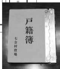
今まで使われていた戸籍簿