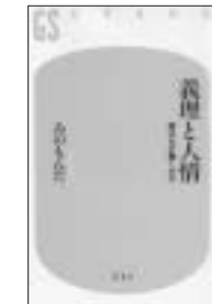
みのもんだ 幻冬舎

屈辱を味わったサラリーマン時代、芸能界から干され、ひたすらトラックで営業回りの10年間。今、こうして仕事ができるのは、人の情けのおかげ。その情けに報いるため働き続ける「日本一働く男」が仕事とお金の哲学を語る。