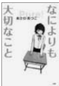
あさのあつこ PHP 研究所

友だち・将来の夢・恋愛・自分のこと…。「バッテリー」「ありふれた風景画」「えりなの青い空」など多数の著作の中から、10代の少女少女に届けたい言葉を集めたメッセージブック。