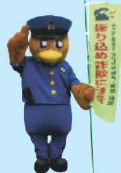
▲茨城県警のシンボルマスコット ひばりくん