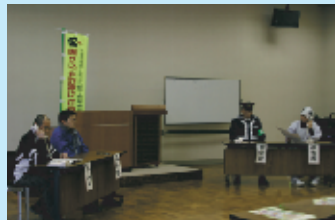
▲署員たちによる「だまされたふり作戦」の寸劇

不審な電話を受けたら迷わず下記までご連絡ください。 笠間警察署 ☎0296-73-0110