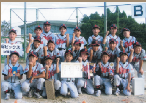
優勝 石塚ビックス野球スポーツ少年団

近隣の少年野球スポーツ少年団12チームで行われた第9回御前山近郊少年野球大会（御前山ビクトリー野球スポーツ少年団主催）で、石塚ビックスが優勝しました。