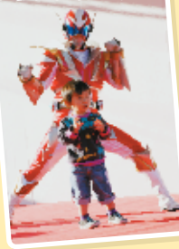
キャラクターショー