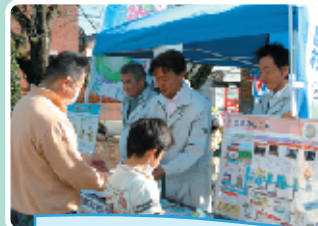
下水道接続推進キャンペーン