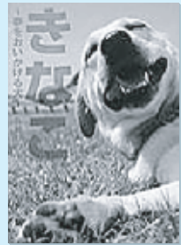
百瀬しのぶ 小学館

警察犬の訓練士になるため、訓練所で働くことになった杏子。しかしそこは、見習いが次々に逃げ出すとんでもない訓練所で…。見習い警察犬「きなこ」と見習い訓練士の杏子が織りなす感動のキズナ。