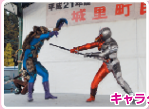
キャラクターショー