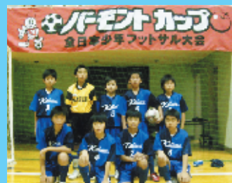
桂サッカースポーツ少年団