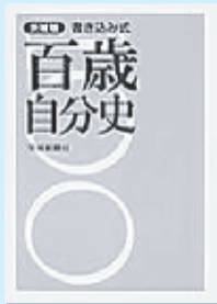
茨城新聞社出版局

昭和・平成の世相年表と照らし合わせながら、自身の入学、卒業、就職、結婚などを書き込むことで次々と出来事を思い出し、あなただけの自分史ができる。本格的な「自分史」執筆の資料としても活用できる。