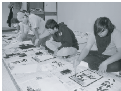
左：書道に取り組む留学生たち 中央：校長室で記念写真 右：日本語講座 (本校生が歌舞伎の台詞を紹介)

留学生は、書道や折り紙などの日本文化に触れ、生徒と一緒に授業を受けました。生徒だけでなく、教職員にとっても貴重な経験ができた5日間でした。