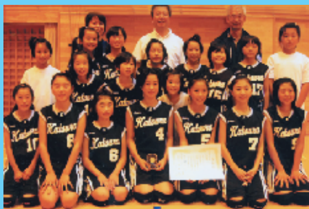
準優勝 桂ミニバススポーツ少年団

中央東ミニバスケットボール秋季大会(中央東ミニバスケットボール連盟主催)が行われ、女子の部に出場した桂ミニバススポーツ少年団が準優勝の好成績を収めました。