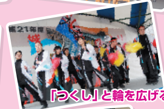
「つくし」と輪を広げる会