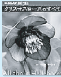
横山暁 日本放送出版協会

急速に品種改良が進む、まだまだ発展途上の植物であるクリスマスローズ。そんなクリスマスローズのある風景や花図鑑、関東地方以西を基準に興味で楽しむための栽培方法、世界のクリスマスローズなどを写真満載で紹介。