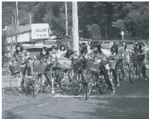
左：午後の部スタート！ 右上：サイクリングを楽しむ 右下：昼食の様子

当日は秋らしい天気に恵まれ、城里町と常陸大宮市にまたがる約40キロのコースを自転車で走り、全校生徒がさわやかな汗を流しました。