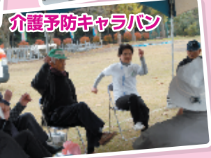
介護予防キャラバン