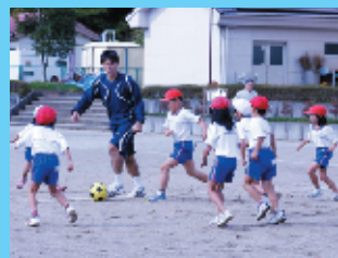
▲ 紅白のチームで試合