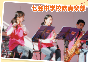
七会中学校吹奏楽部