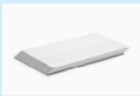
コロンプスのまな板

茨城から生まれた多様な秀なデザインの事例を製品やパネルで紹介いたします。どうぞお来場ください。