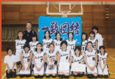
優勝した桂ミニバススポーツ少年団

近隣のミニバススポーツ少年団32チームで行われた海老沢清カップミニバス大会（海老沢清カップ実行委員会主催）で、桂ミニバススポーツ少年団が見事優勝しました。